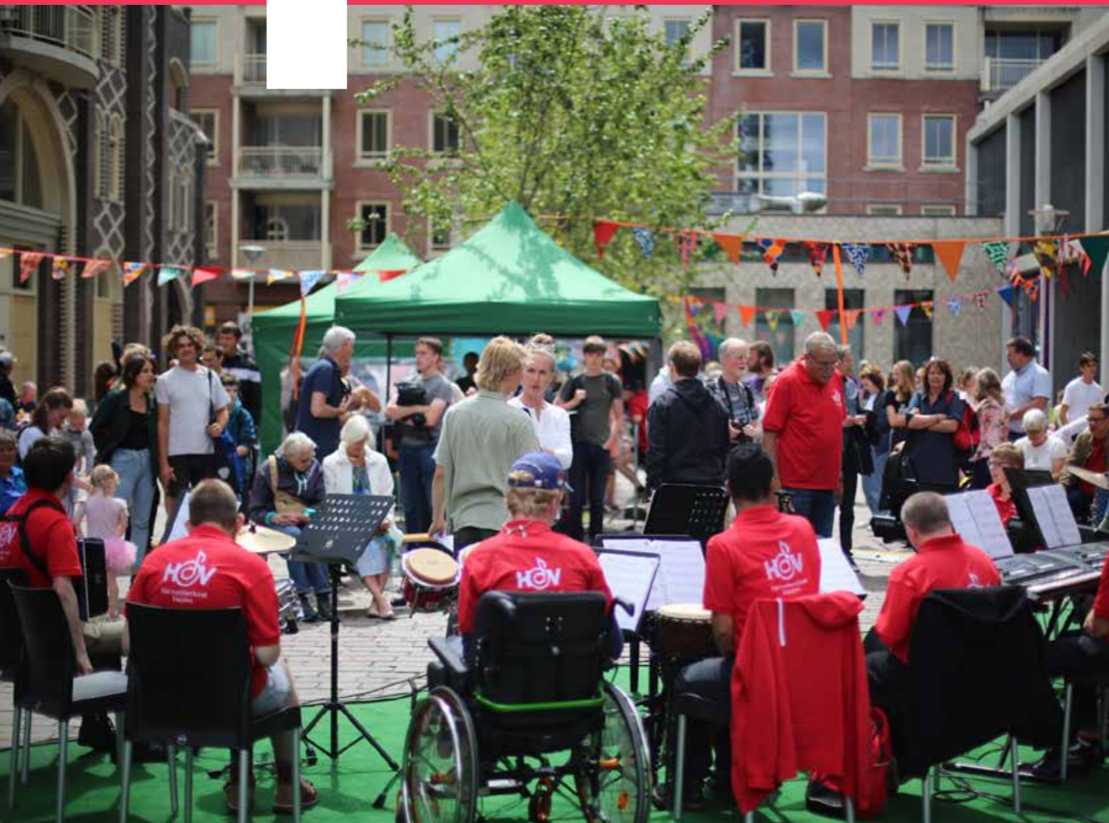
HOV • foto: MediaMaker VC Utrecht Fouad Hallak