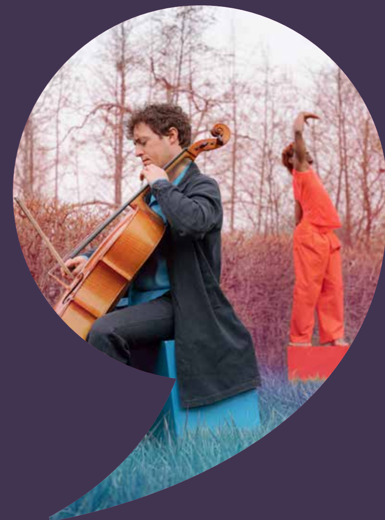
Zingende Beelden 2023 • Foto: Loek Hennipman

Stichting Philomela Studio De Bakkerij Studio Moskou SUB speeltuinen Theatergroep De Hangouderen Theaterschool Utrecht Tivoli Vredenburg Trap-Op Tune In UC – Crew Utcast Utrecht Marketing Vioolschool Amadeus 4-strings Vocal Arts Academy VOLT Vrienden van het Maximapark VuUuR/House of HipHop Wunderle X11 ZIMIHC