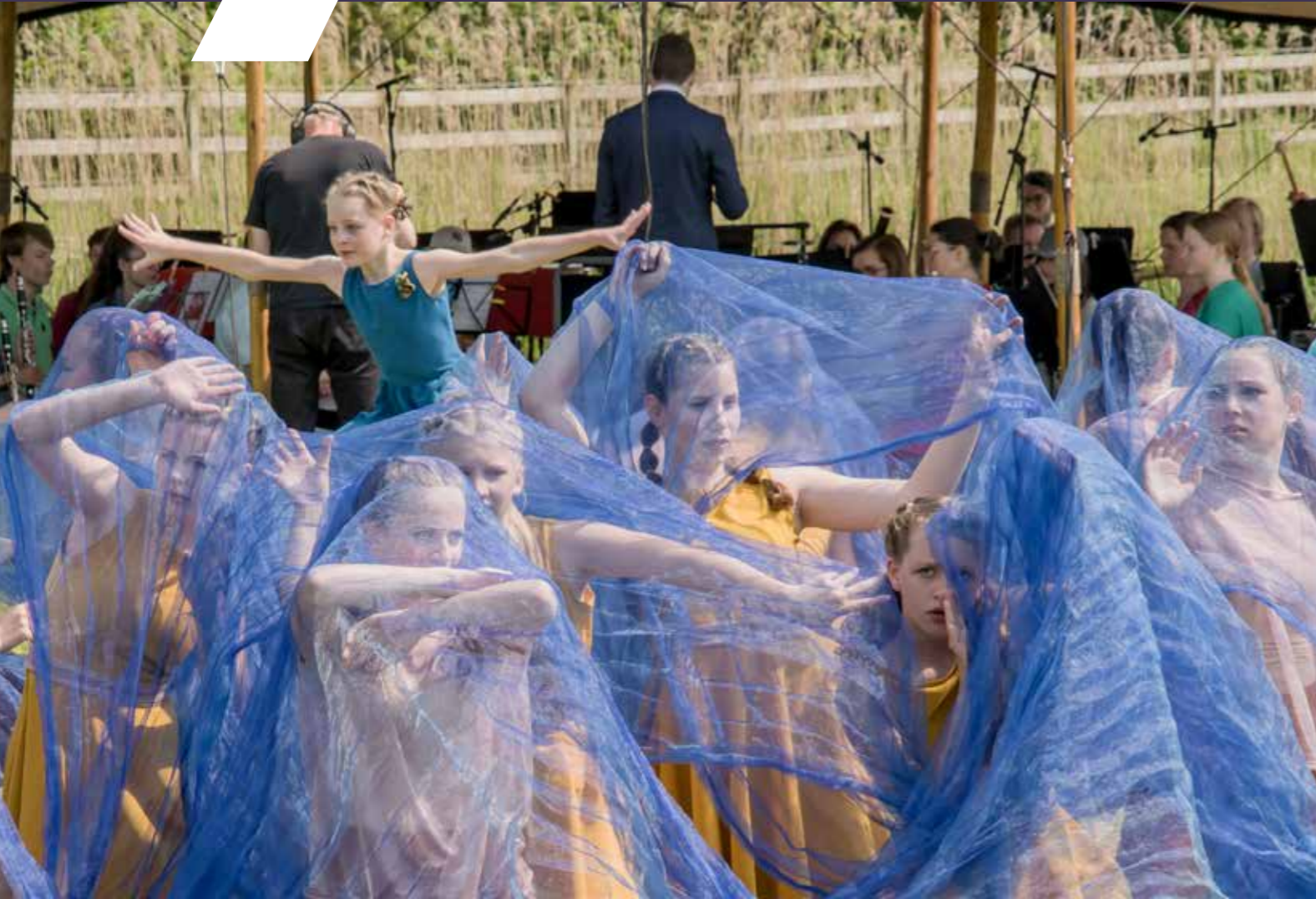
Zingende beelden 2023 • Foto: Wijnanda Pijper