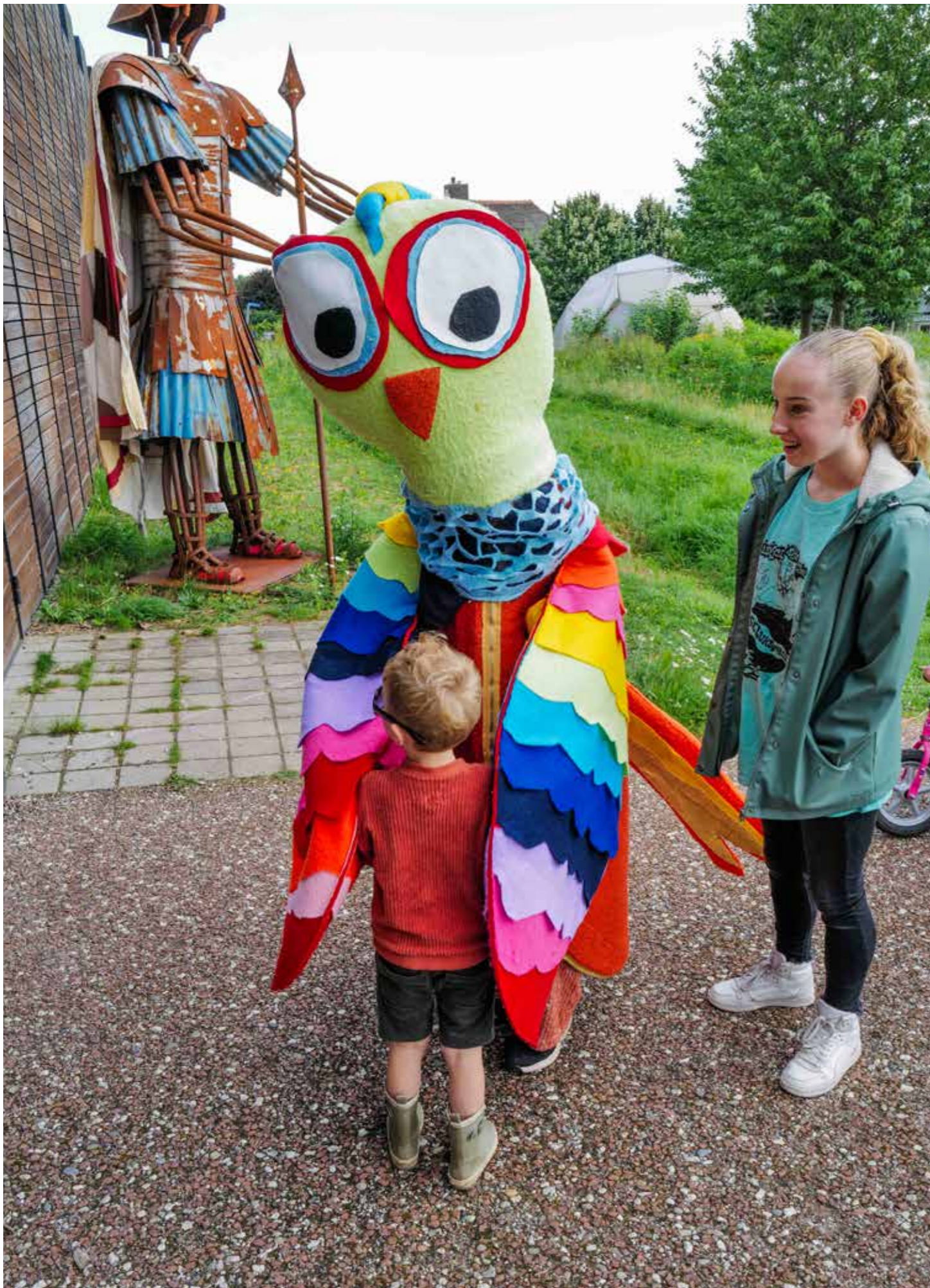
Leidsche Rijn Festival 2023 • Foto: Johan Hahn

Beheer/floormanagement Beheer (oproep, tijdelijk) Gebouw en advies