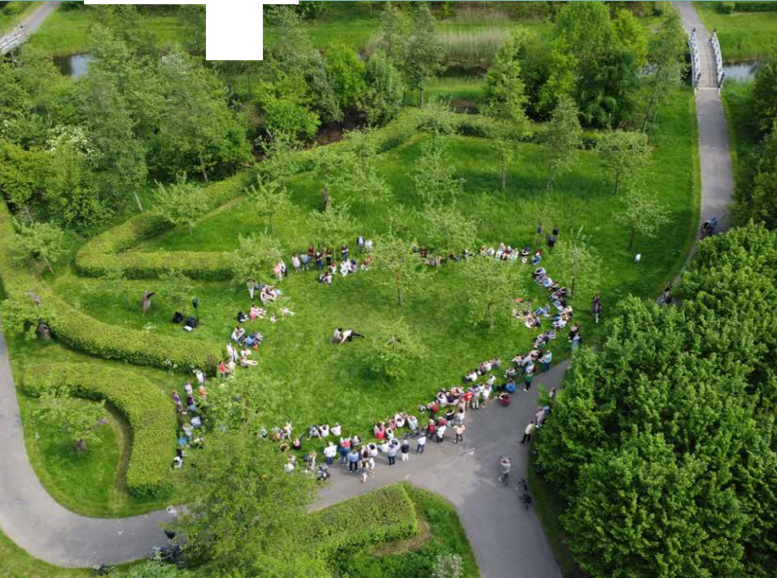
SHIFFT, Zingende Beelden 2023 • drone shot: Frank ten Have