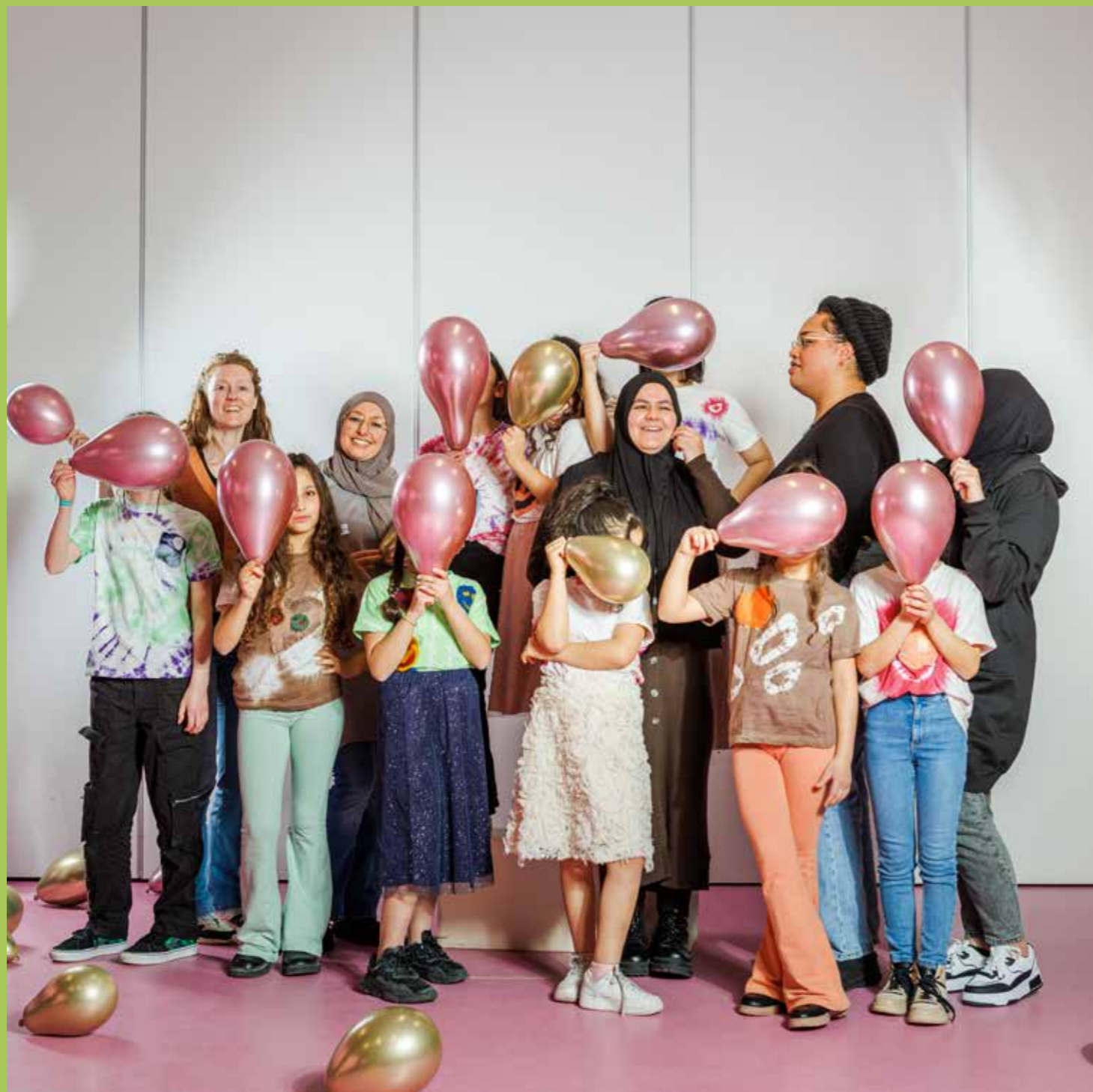
Dress & More • foto: Irina Burak