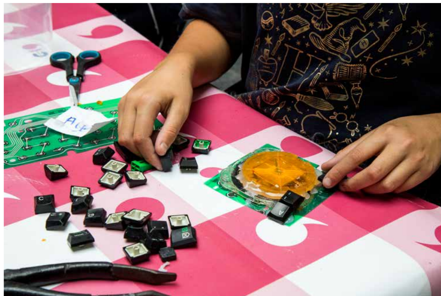
In Je Makie 2023