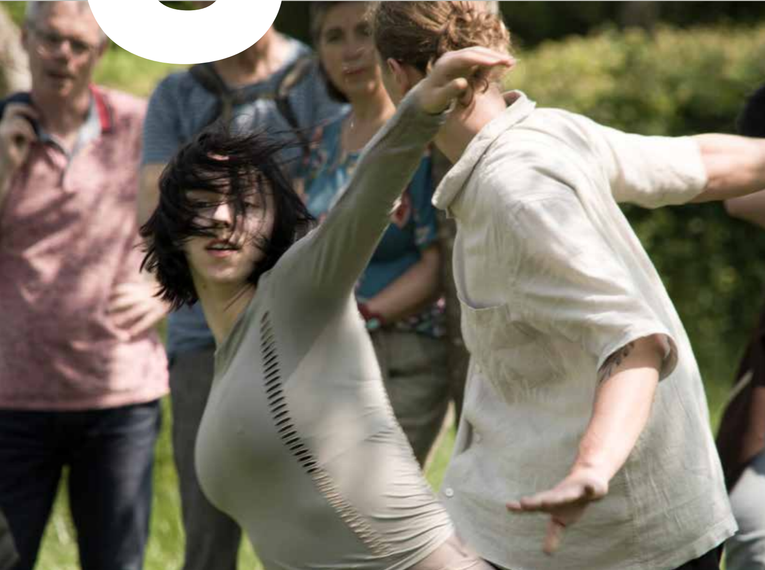
Zingende beelden 2023