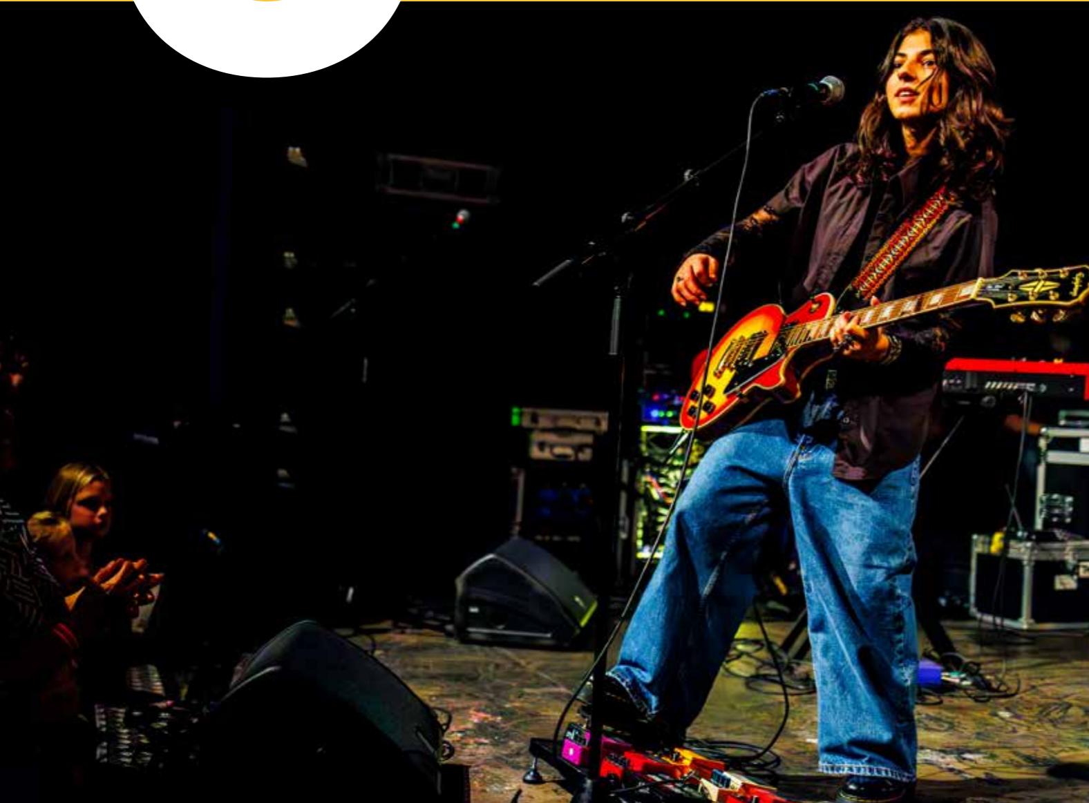
Limerent, Grote Prijs van Leidsche Rijn 2023