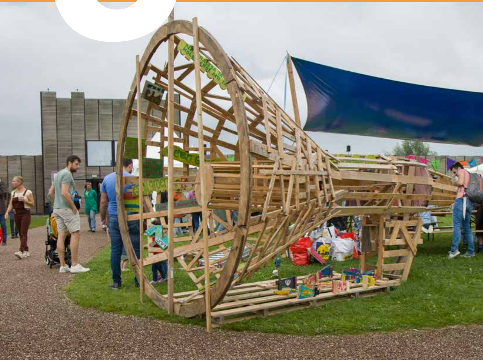
Leidsche Rijn Festival 2023