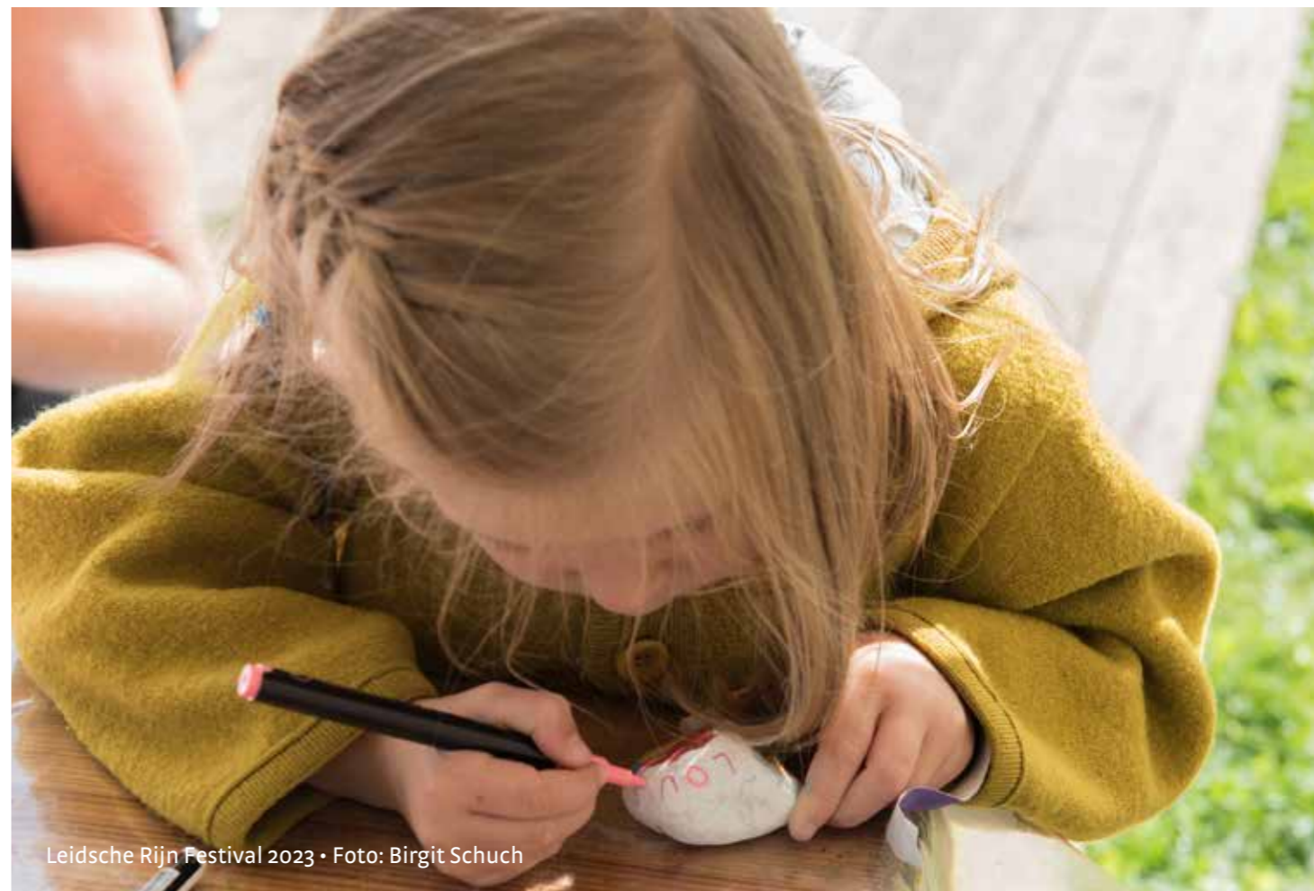
Leidsche Rijn Festival 2023 • Foto: Birgit Schuch